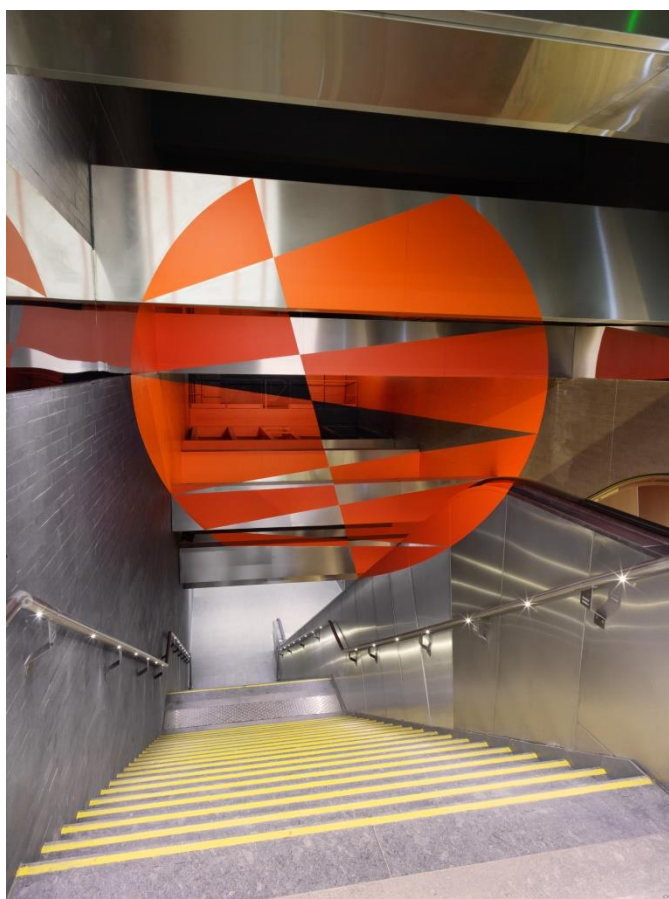
Felice Varini « Zig Zag dans le disque » Toulouse 2020

Cet accès à la station ayant été complètement modifié dans le cadre des travaux d'extension des quais de la ligne A, Tisséo Collectivités a commandé une nouvelle œuvre à l'artiste. Felice Varini a donc conçu une anamorphose en référence à ses travaux récents pour cet espace reconfiguré à partir des nouvelles données spatiales et architecturales.