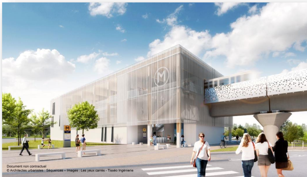
Vue de la station Parc Technologique du Canal

Une rame sur quatre desservira ce nouveau tronçon en heures de pointe soit une fréquence d'environ 5 minutes. L'amplitude horaire sera la même que pour les autres lignes de métro déjà en service.